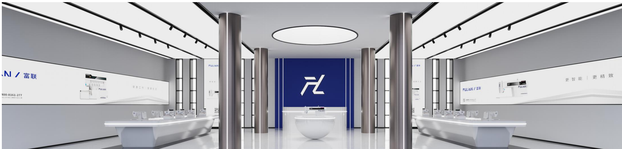
富联加盟商2.0旗舰店